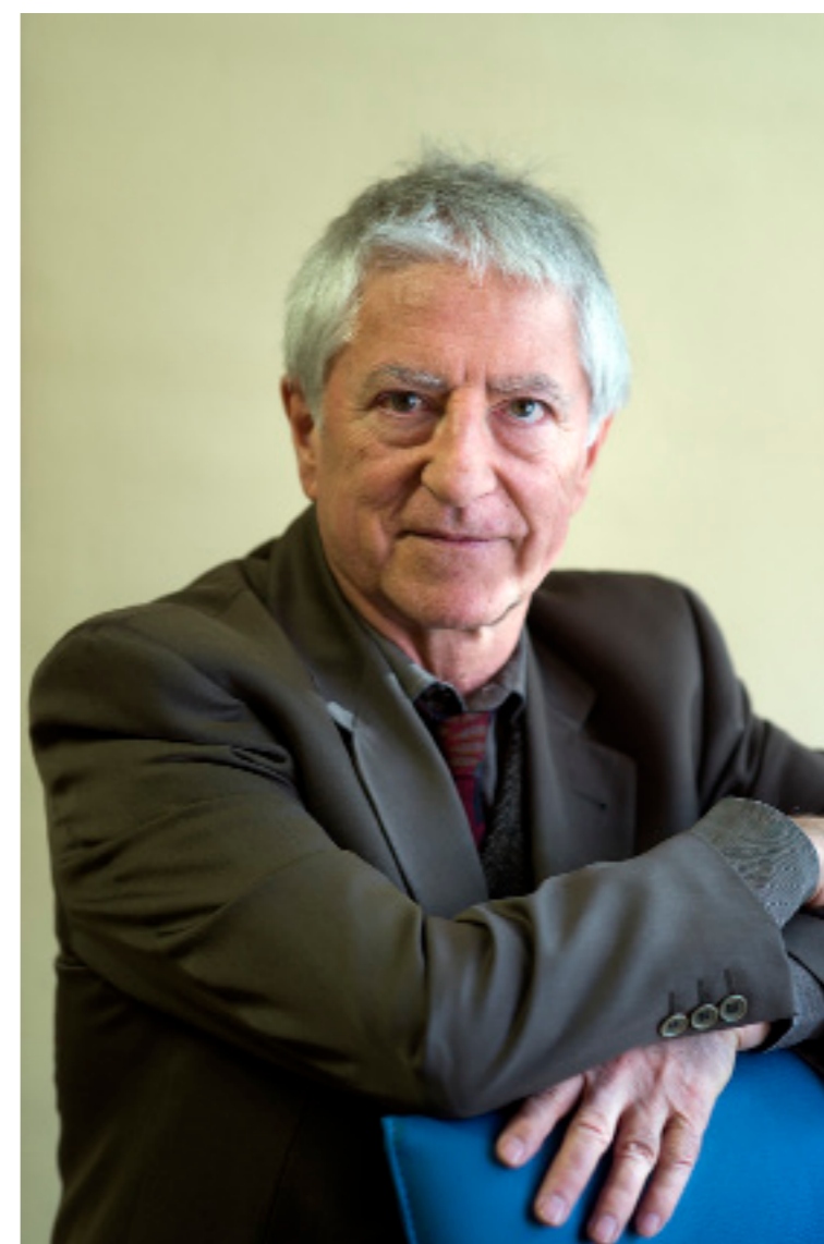
“La naturaleza humana está en el genoma. Las demás cosas son variables”

– A mí me interesan mucho los animales y su mundo y el de la naturaleza me parece muy bonito, es como una especie de fiesta constante. Aparte de eso yo en aquella época estaba complementando mis parvos ingresos académicos con mi actividad en la editorial Salvat. En ese momento estaba empezando la venta de colecciones por fascículos y eso coincidió con los programas de la televisión de Félix Rodríguez de la Fuente, que tenían un gran éxito. En Salvat pensamos que sería interesante conjugar las dos cosas para hacer una obra sobre los animales así que lo pusimos en marcha y yo incluso estuve en África y otros sitios con Félix Rodríguez