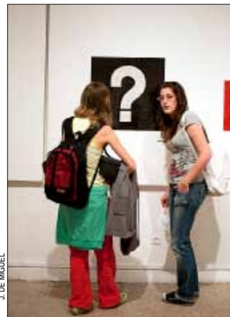
En estas páginas algunas imágenes de la muestra Expresáte que busca concienciar sobre la realidad y los riesgos del SIDA, treinta años después de su aparición. Gran parte de las obras son fotografías, pero también hay alguna escultura denuncia, pinturas y dibujos.

Los trabajos han sido realizados por estudiantes de Bellas Artes del campus de Moncloa y del CES Felipe II de Aranjuez