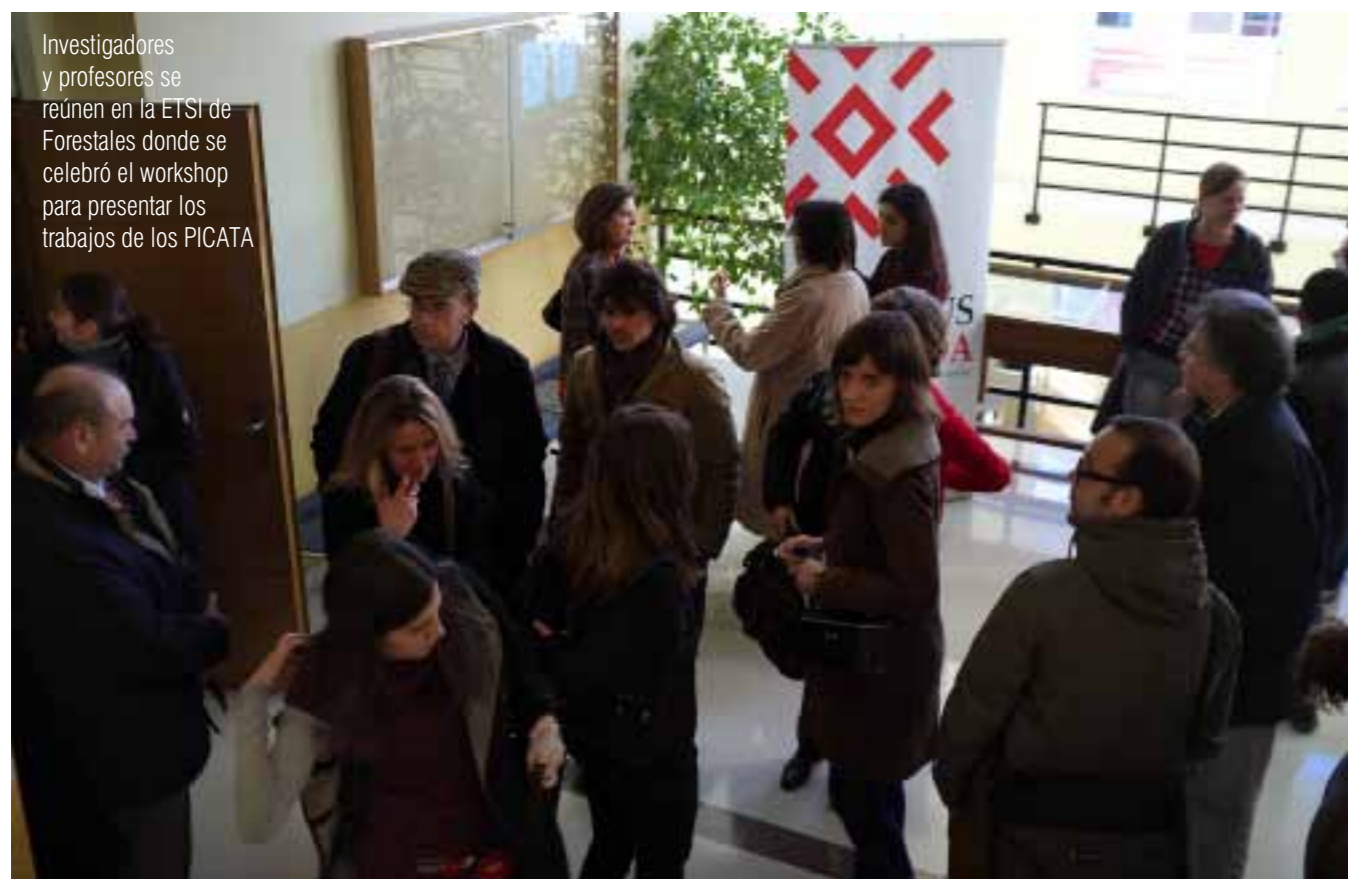
Investigadores y profesores se reúnen en la ETSI de Forestales donde se celebró el workshop para presentar los trabajos de los PICATA