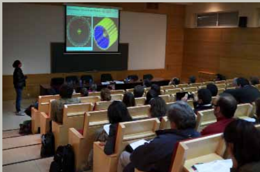
El salón de actos de la Escuela Universitaria de Ingeniería Técnica Forestal acogió el workshop en el que los PICATA presentaron los trabajos en los que se encuentran involucrados

Como se ve, PICATA tiene dos vertientes. Por un lado, gente que hace la tesis doctoral en el Campus Moncloa y, por otro, la incorporación de doctores jóvenes. Las becas y contratos predoctorales son de cuatro años de duración para la realización de