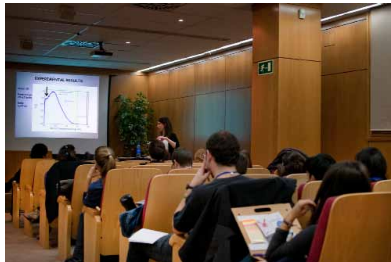
Investigadores de toda España se reunieron en el salón de actos de la Facultad de Químicas

TEXTO: JAIME FERNÁNDEZ