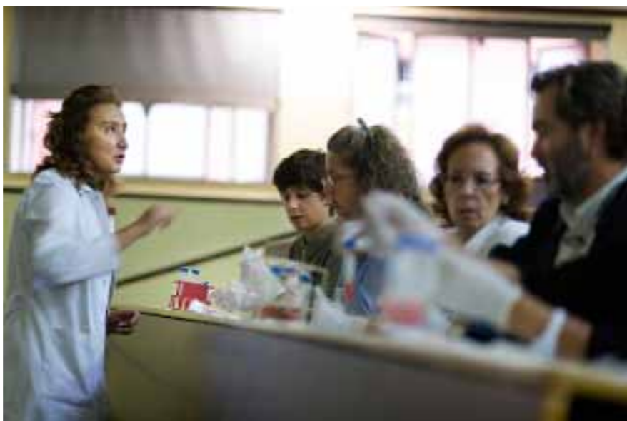
En estas fotografías, diferentes momentos del experimento que consistió en mezclar una toxina con sangre para ver cómo destruye a los glóbulos rojos de manera casi inmediata.

La jornada terminó con una visita guiada a los terrarios con animales venenosos que llevó a la Facultad de Químicas el grupo ATROX, una asociación que nació en 1979 con el objetivo de estudiar y divulgar temas relacionados con la naturaleza.