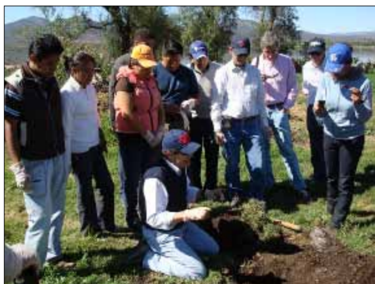
En estas imágenes algunos de los momentos del proyecto tanto en el trabajo de campo como en los distintos laboratorios. También se pueden ver las aguas negras y contaminadas del valle del Mezquital.